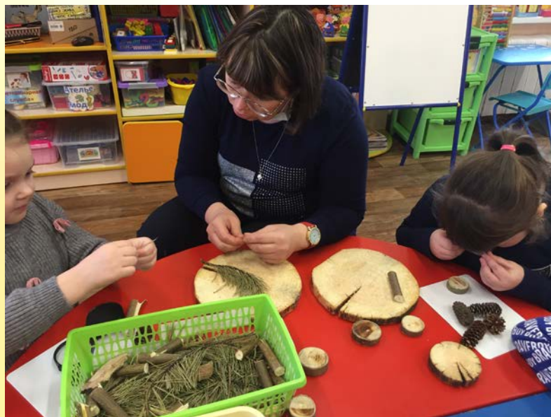
Природные материалы для исследования