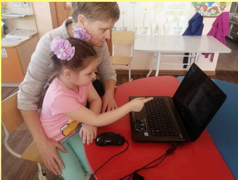
Ноутбук с подключенным голосовым помощником