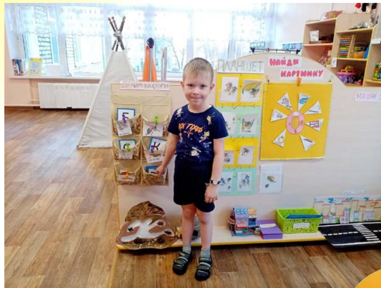
Схемы с вопросами и алгоритмами по теме проекта