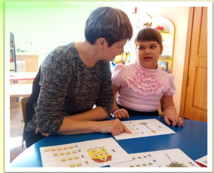
Коррекционно-развивающая игра «Один – много»