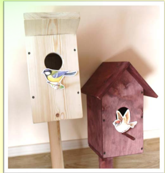
Трудовой десант «От каждой семьи - по скворечнику»