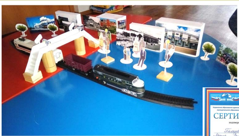
Интерактивный макет «Наш город-Нижнеудинск»